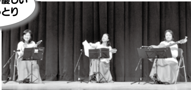
マンドリンアンサンブル カリエンテ