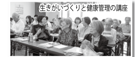
生きがいつくりと健康管理の講座