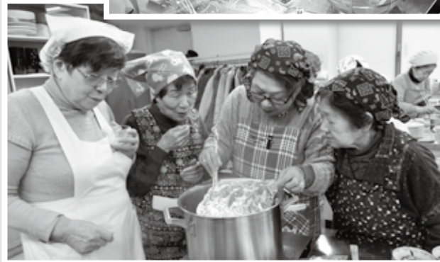
手際よく調理を実施