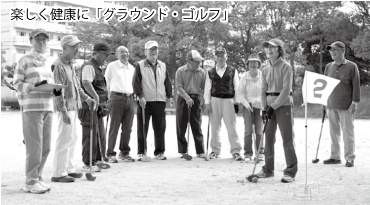
楽しく健康に「グラウンド・ゴルフ」