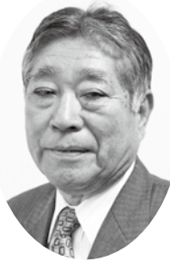
博多区老人クラブ連合会