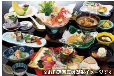
※お料理写真は潮彩イメージです。