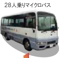
28人乗りマイクロバス